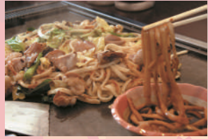
佐用ホルモン焼きうどん