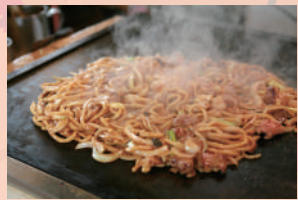
津山ホルモンうどん